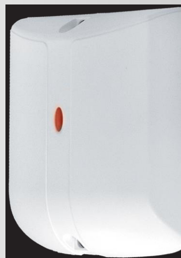
Dimensions produit (Hauteur x Largeur x Profondeur) 105mm x 83mm x 40mm